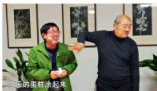
开心的蛋糕涂起来