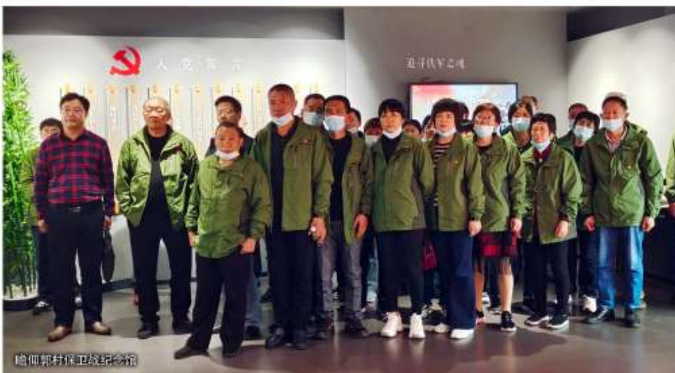
瞻仰郭村保卫战纪念馆