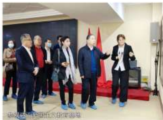
参观泰山交运物流产业园