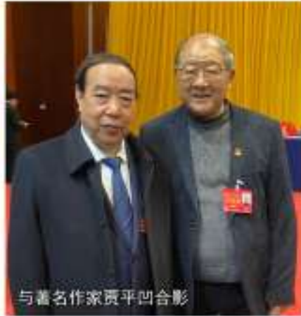
与著名作家贾平凹合影