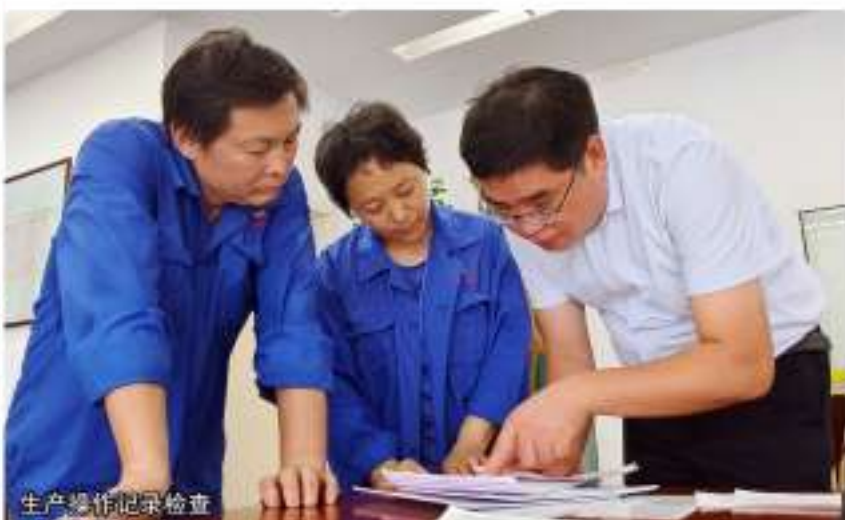
生产操作记录检查