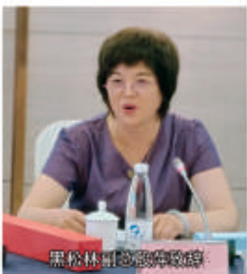
黑松林副总经理致辞