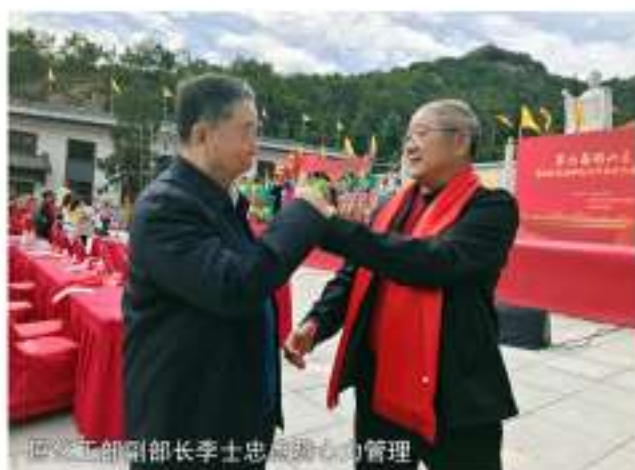
原化工部副部长李士忠点赞心力管理