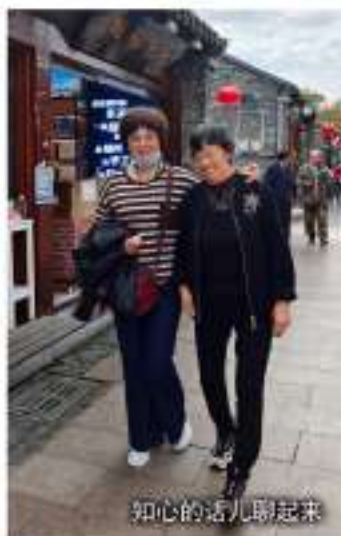
知心的话儿聊起来