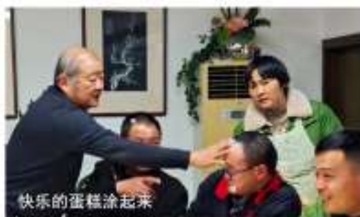
快乐的蛋糕涂起来