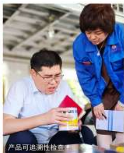
产品可追溯性检查