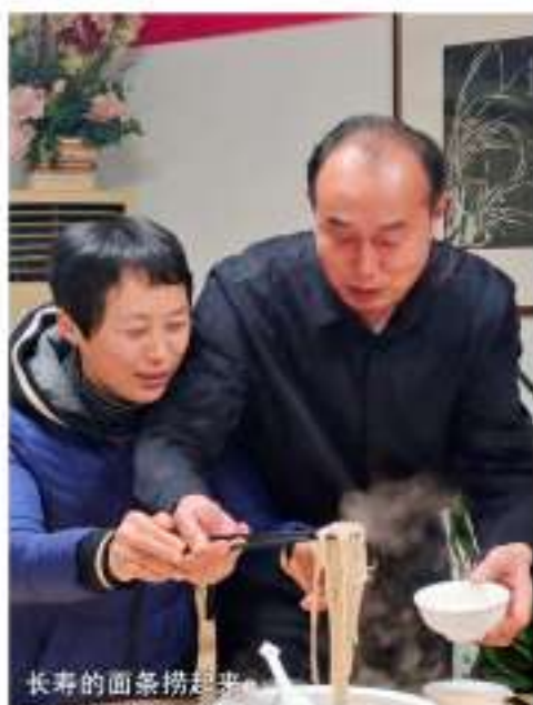
长寿的面条捞起来