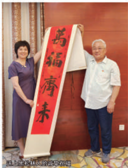
连云港黑松林人的诚挚祝福