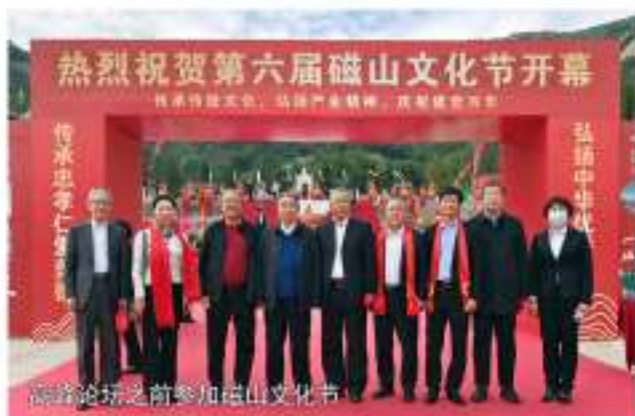
高峰论坛之前参加磁山文化节