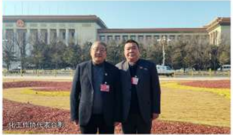
化工工作协代表合影