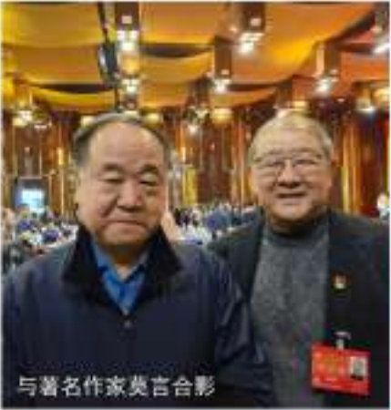
与著名作家莫言合影