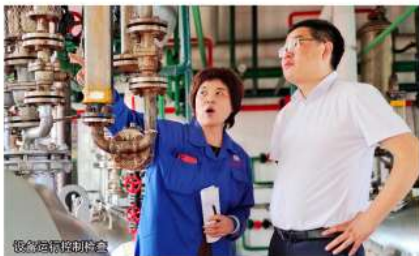
设备运行控制检查