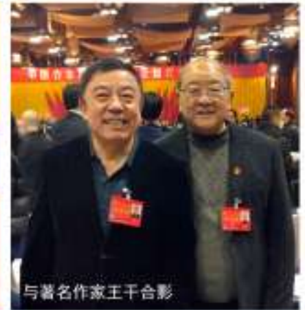
与著名作家王干合影