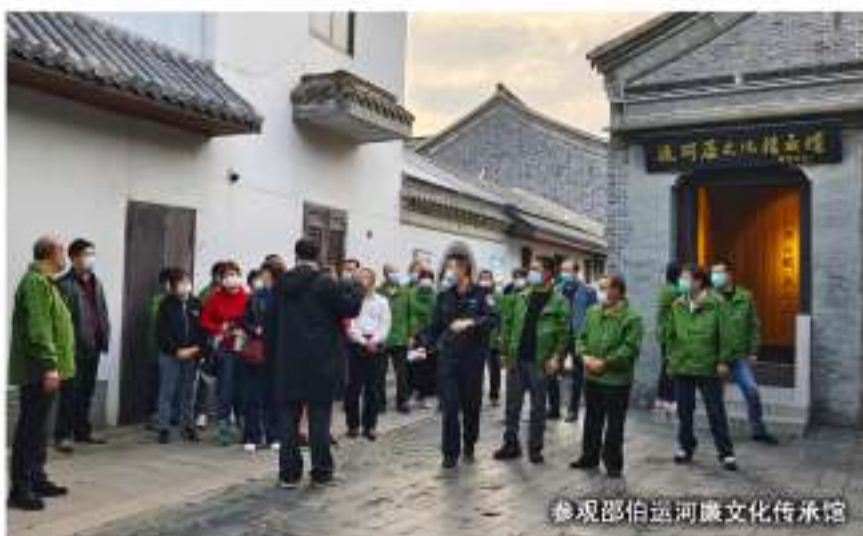
参观邵伯运河廉文化传承馆