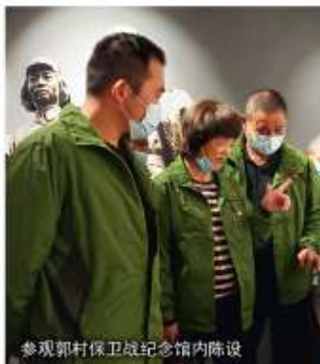
参观郭村保卫战纪念馆内陈设