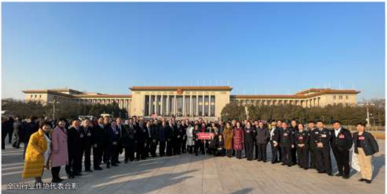
全国行业作协代表合影