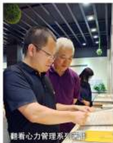
翻看心力管理系列书籍