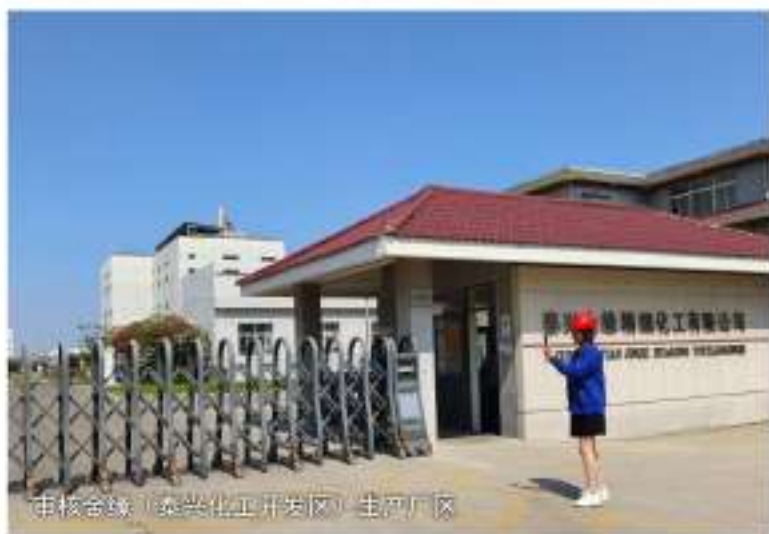
审核全联（泰兴化工开发区）生产厂区